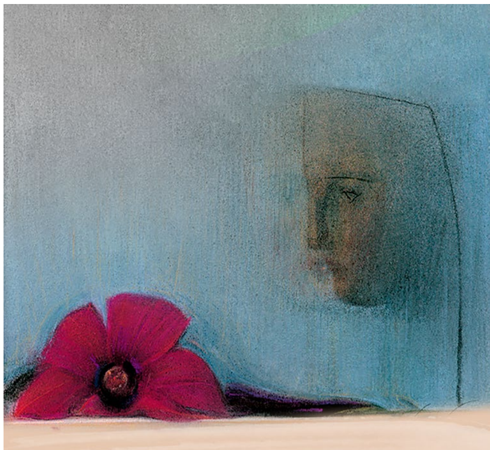
PIERO GUCCIONE, La maschera e l'ibisco , 1995